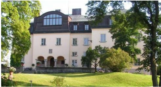
Prins Eugens Waldemarsudde

Vi besöker Prins Eugens Waldemarsudde samt Thielska galleriet